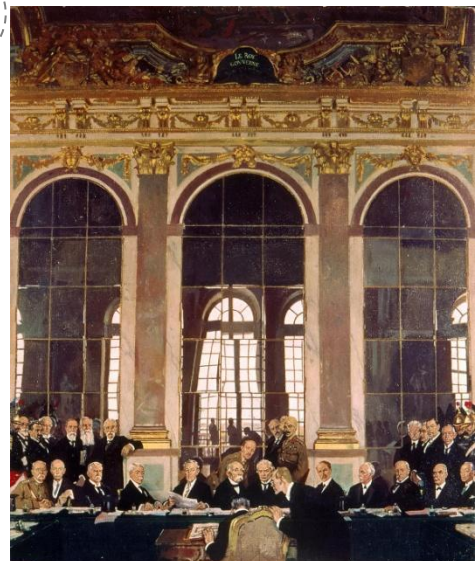
La signature du traité de Versailles (Tableau de W. Orpen, 1919)