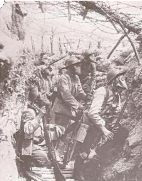
Poilus dans une tranchée entre 1915 et 1918